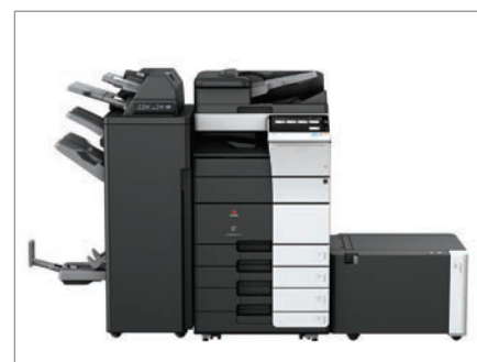
Konfiguration mit FS-537SD Finisher, PI-507 Zuschleifeinheit, PC-215 Universalkassette und LU-207 Großraummagazin