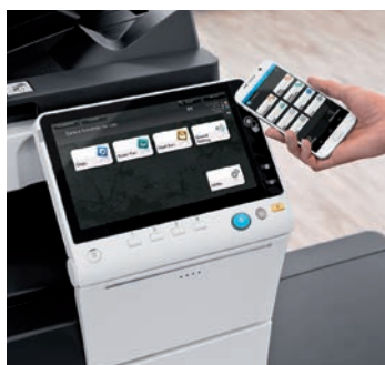
Neues 10.1" Touch-Bedienfeld mit NFC Authentifizierungsbereich